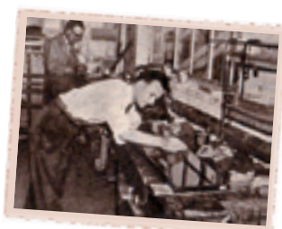
Eventuele kleine beschadigingen van het Afrikaanse mahonie finer worden met een fijn penseel gecorrigeerd