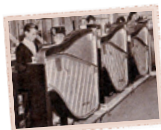
Maestro's laten hun achterzijde zien