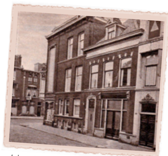
In het middelste pand, Bilderdijkstraat 151 in Den Haag, werd de Maestro-piano geboren