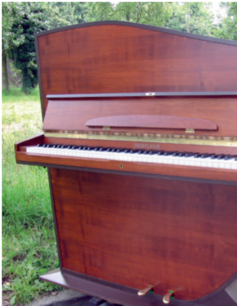
Het mechaniek van een Maestro

De productie groeide gestaag, en het personeelsbestand nam toe tot 200 man. Eerst werden elke werkdag 12 piano's (en later ook de bijzondere gegoten aluminium Rippen vleugels) in serieproductie gebouwd. Op zeker moment was de vraag naar instrumenten zó groot dat Johan Rippen het personeel bijeen riep