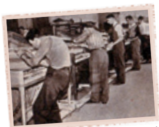
Het afregelen van een serie Maestro's